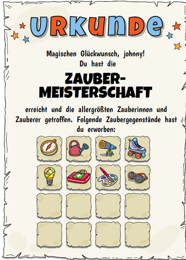
Beispiel einer Urkunde

Es wurden 8 Zaubergegenstände gesammelt. Der Spieler hat also Beiträge aus den abgebildeten Berufsfeldern angesehen und bewertet.