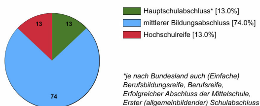
Ausbildungsanfänger/innen 2022 (in %)

Rechtlich ist keine bestimmte Schulbildung vorgeschrieben. In der Praxis stellen Betriebe überwiegend Auszubildende mit mittlerem Bildungsabschluss ein.