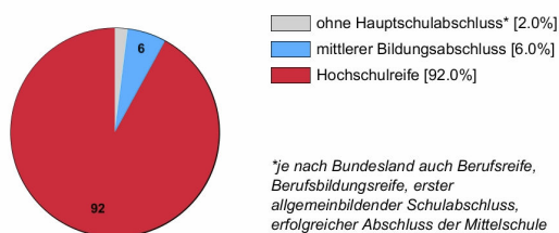
Ausbildungsanfänger/innen 2016 (in %)

Rechtlich ist keine bestimmte Schulbildung vorgeschrieben. In der Praxis stellen Betriebe überwiegend Auszubildende mit Hochschulreife ein.